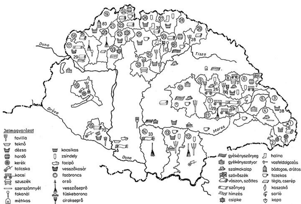
1. ábra: Kiemelkedő háziipari központok, termékek, 19. század második fele