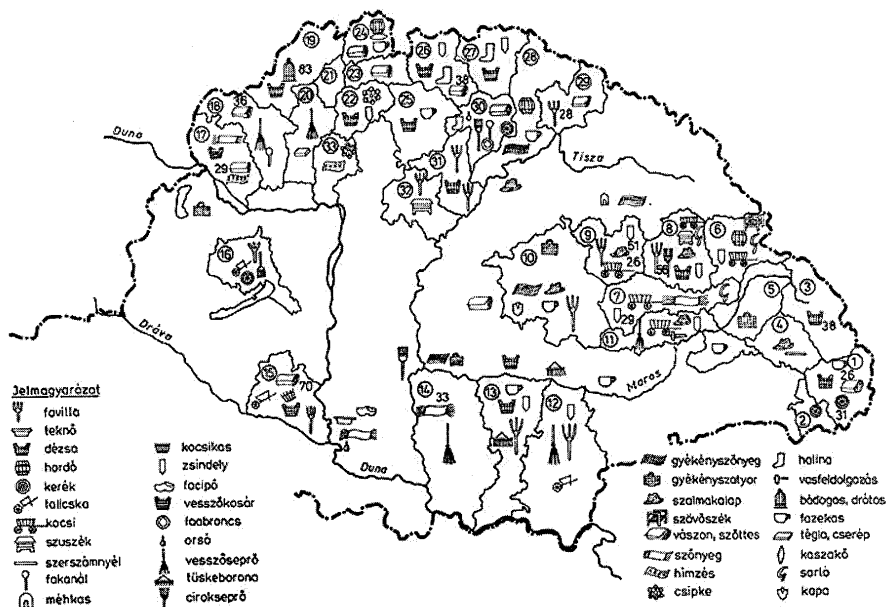
1. ábra Kiemelkedő háziipari központok, termékek, 19. század második fele

Forrás: Paládi-Kovács Attila et al (eds) (1988–2002): Magyar Néprajz, III. kötet, 26. old.